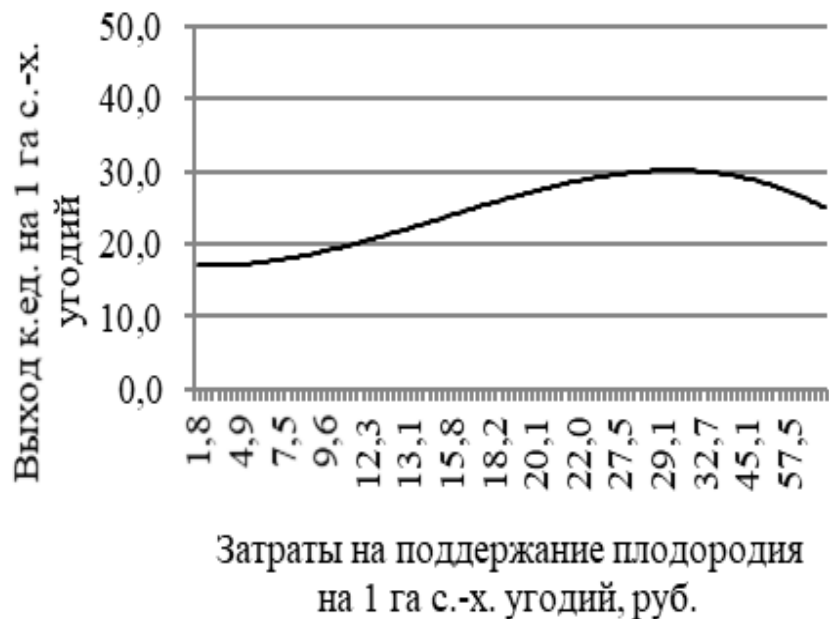
Рисунок 2 – Зависимость уровня затрат на поддержание плодородия и выхода кормовых единиц на гектар по группам с различной кадастровой оценкой сельскохозяйственных угодий (по группам 20,1-24,0 баллов и 36,1-40,0 баллов)